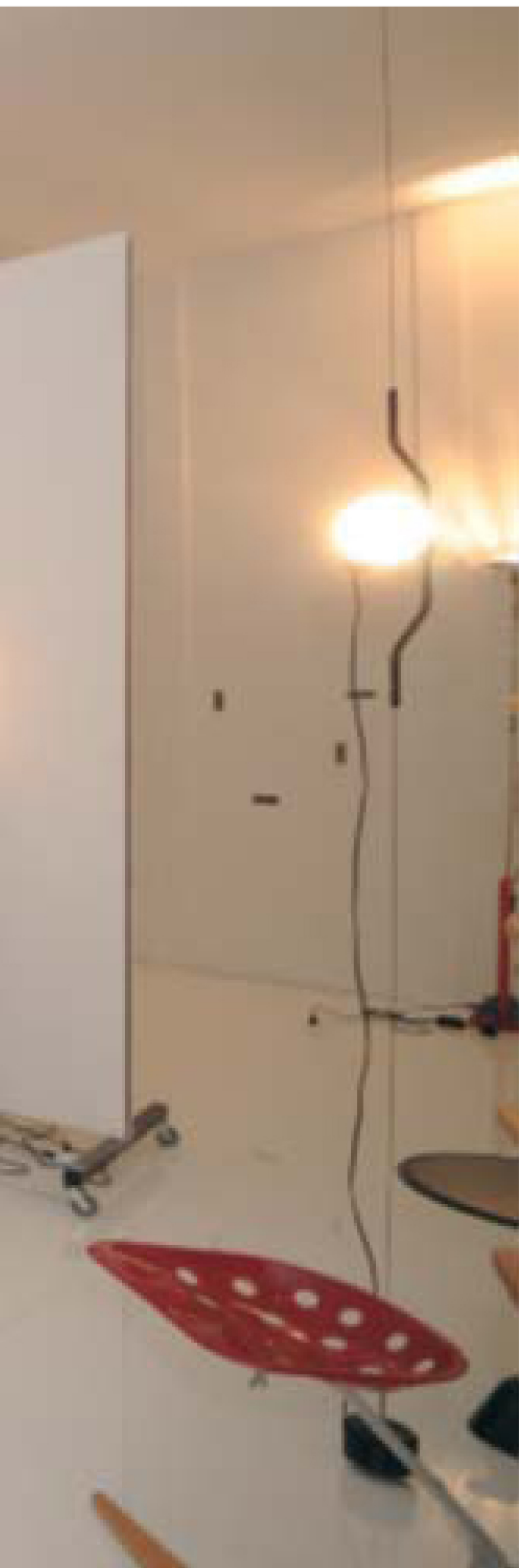
At left: 'The real house' by the studio Astori De Ponti Associati. Below: two fragments of the exhibition 'Memories', curated by Carlo Ninchi and Vittorio Locatelli. Page across: two more models from the exhibition 'Alberti's box' (at top) and a view of the installation 'A casa Castiglioni' (below).